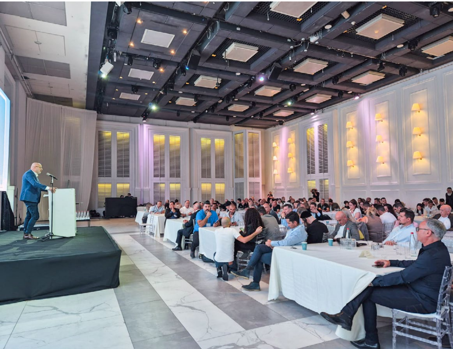
כנס דף חדש.