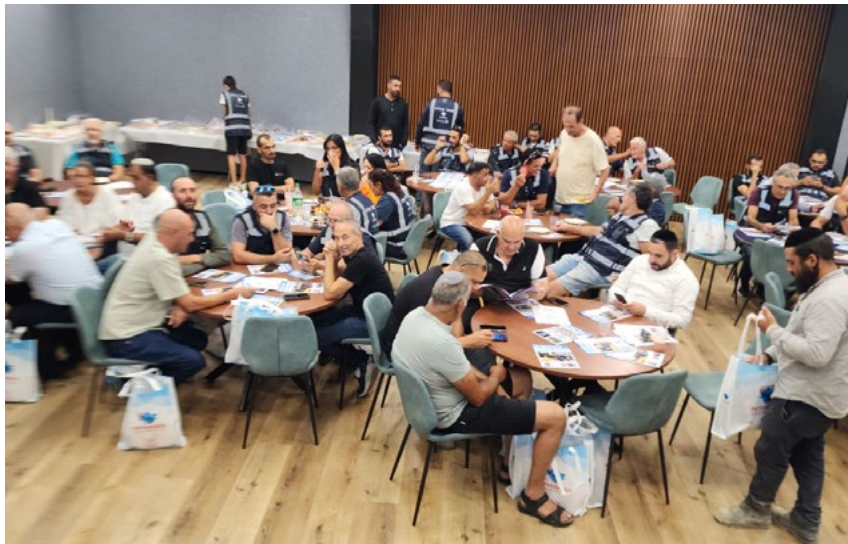
כנס מנהלי עבודה.