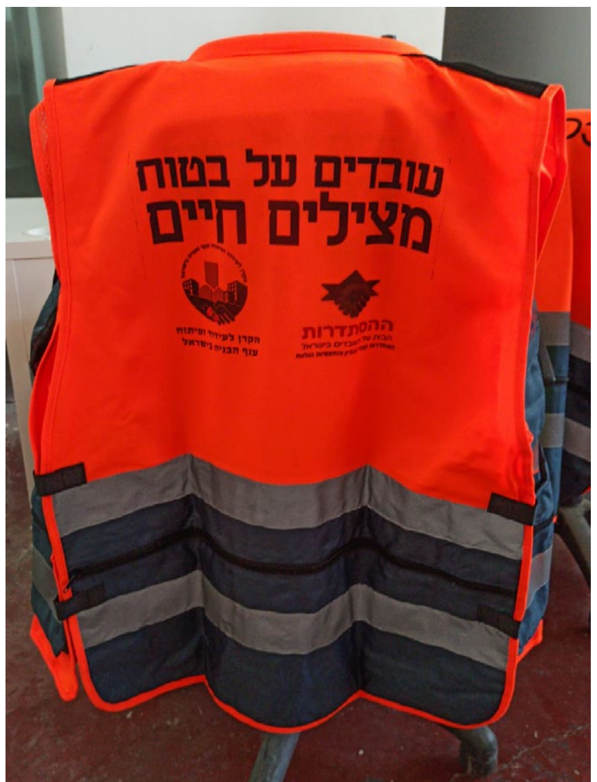
צילום: דוברות ההסתדרות