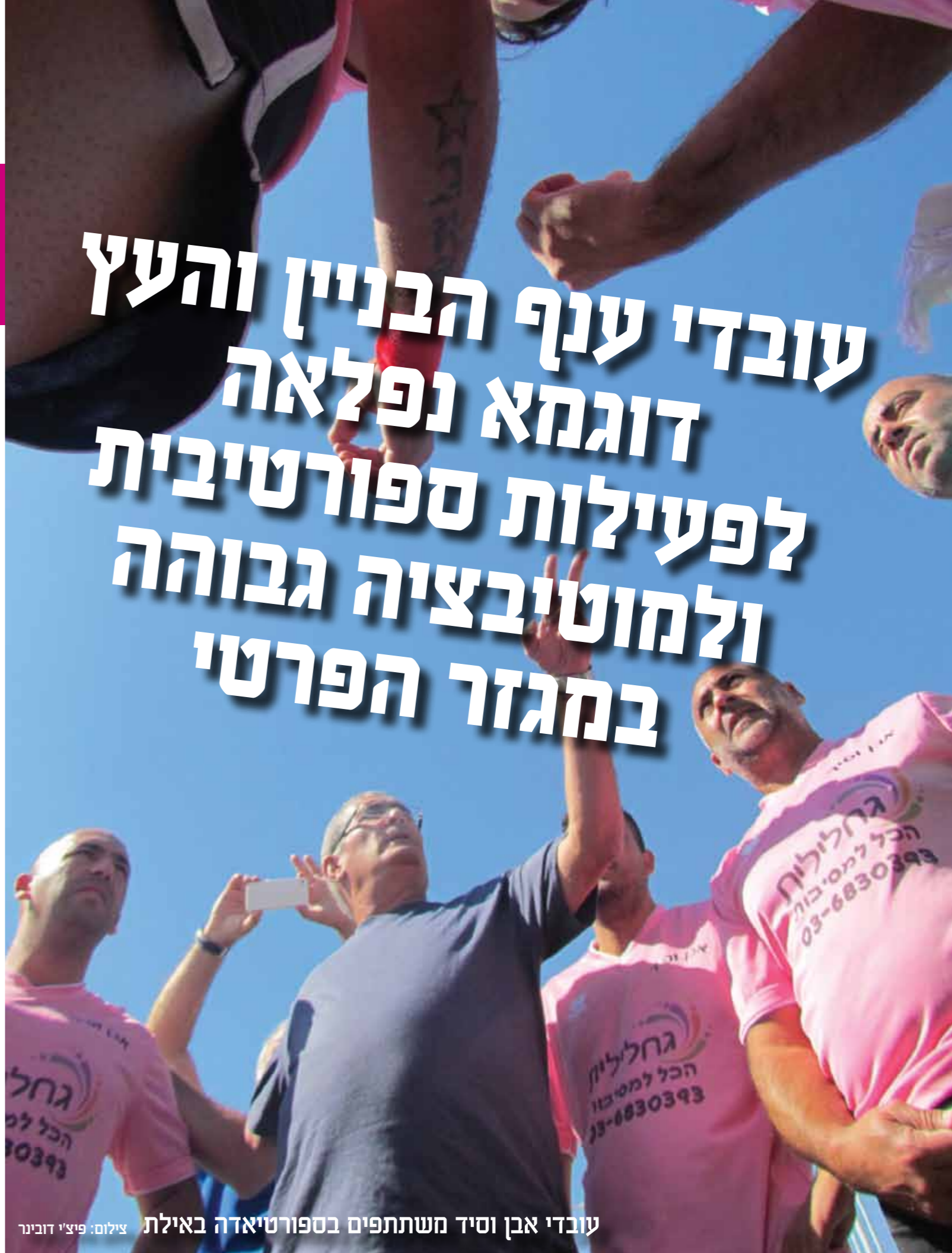
עובדי אבן וסיד משתתפים בספורטיאדה באילת