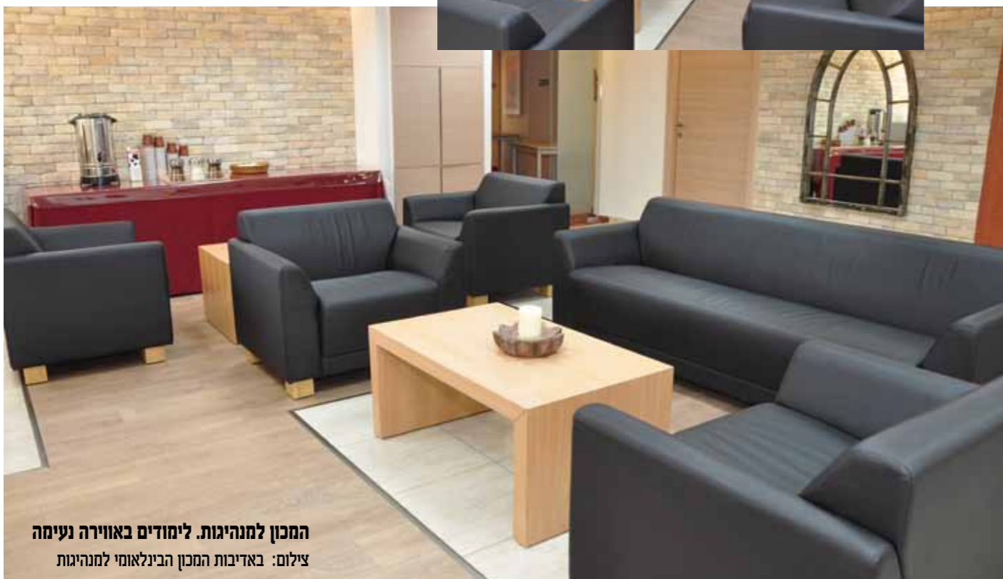
המכון למנהיגות. לימודים באווירה נעימה

"אני רואה את המכון כמקום שוקק חיים ומלא בפעילות של וועדי עובדים, מזכירי איגודים מקצועיים ועובדים".