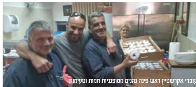
עובדי אקרשטיין ראש פינה פניה נהנים מסופגניות חמות וטעימות