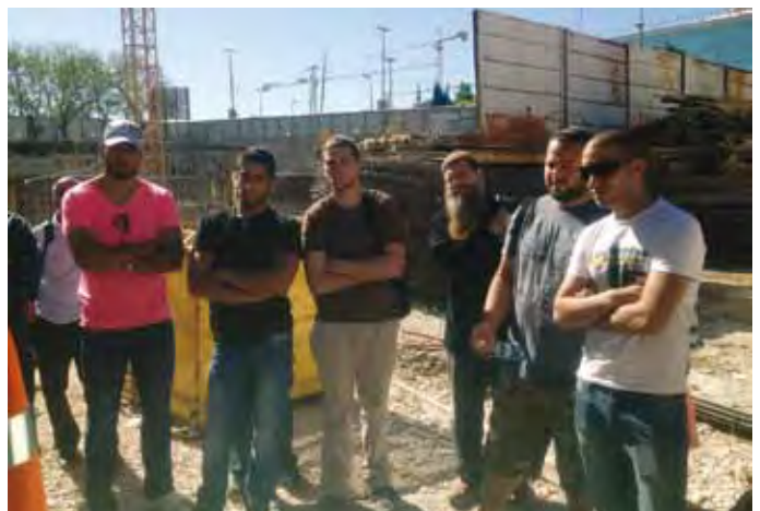
<<< קליטת בוגרי מיזם "בונים ישראלים" בחברת רמט