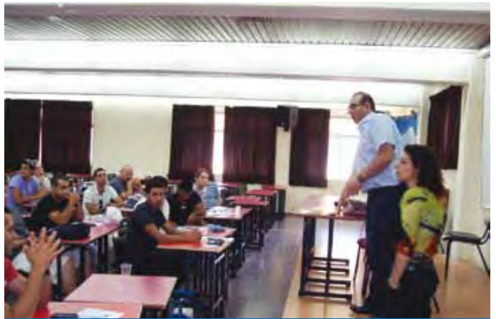
<<< בקרוב: קורס שילדאים ה-16 במספר יוצא לדרך