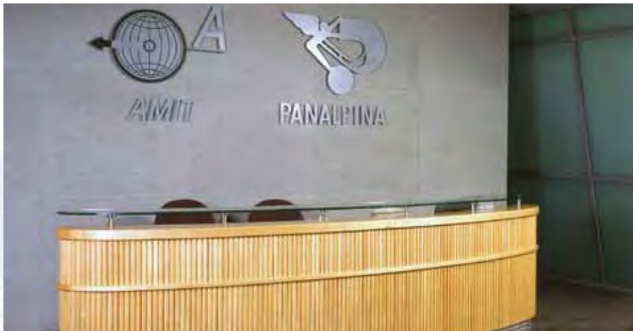
<<< פרויקט ביצוע של "יופי רהיט" ב"עמית חברת שילוח" – דלפק מעוגל מחופה בלייטטים עץ מסיבי. תכנון: פלג אדריכלים