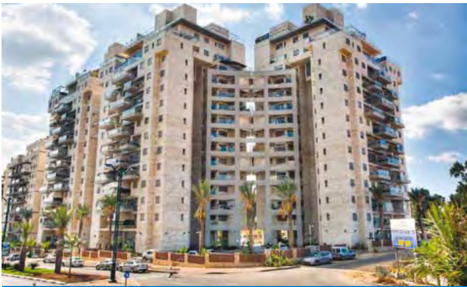
<<< פרויקט "young" בבאר יעקב, יזמות וביצוע: אלמוג כ.ד.א.י בע"מ