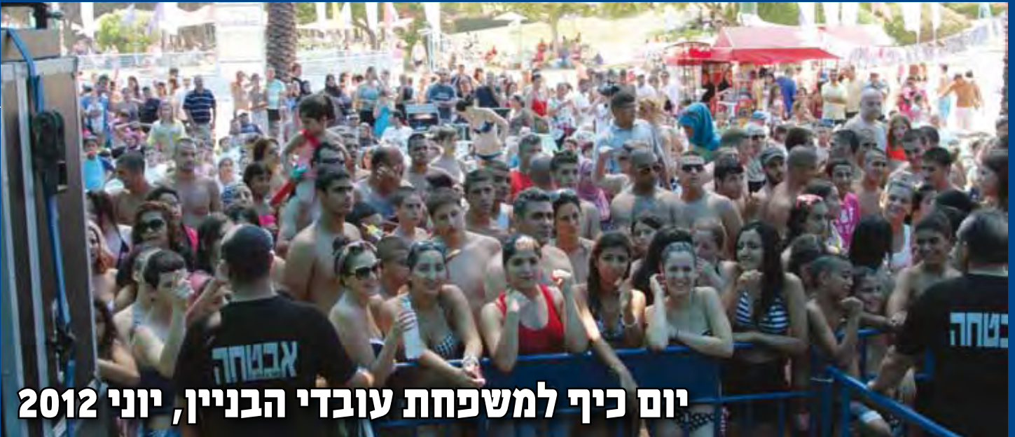
יום כיף למשפחת עובדי הבניין, יוני 2012