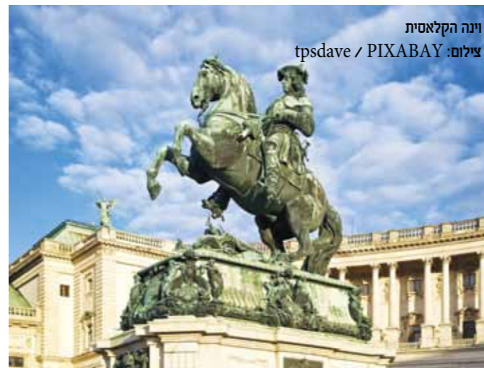
וינה הקלאסית