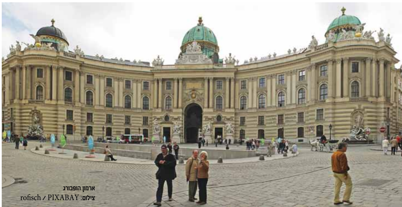
ארמון הופבורג

"העיר העתיקה" של וינה, היא למעשה עיר פנימית, שפעם הייתה מוקפת חומה. החומה נהרסה בשנת 1857 בוהראת הקיסר פרנץ יוזף הראשון ובמקומה נסלל הרחוב הטבעתי, המסמן את תחומי מרכז העיר. לאורך הרחוב ניתן למצוא מבני ציבור אשר נבנו לאורך השנים: בית העירייה, התיאטרון