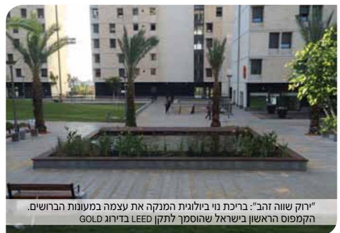
"ירוק שווה זהב": בריכת נוי ביולוגית המנקה את עצמה במעונות הברושים. הקמפוס הראשון בישראל שהוסמך לתקן LEED בדירוג GOLD