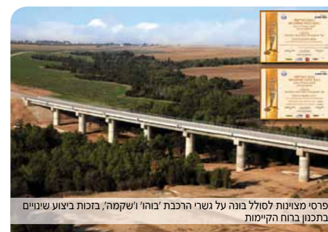
פרסי מצינות לסולל בונה על גשרי הרכבת 'בוהו' ו'שקמה', בזכות ביצוע שינויים בתכנון ברוח הקיימות