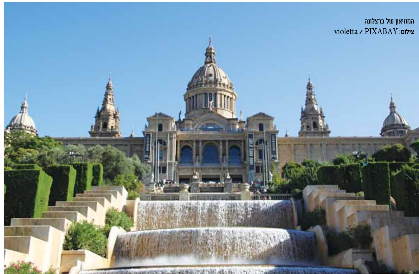
המוזיאון של ברצלונה

המחירים לאדם בחדר זוגי וכוללים מיסים • להזמנת חדשות ע"ב מקום פנוי למלונות המוצעים או דומים • העברות (אם יש) • ההנחות ממחירי מחירון מוצרי סיטונאות אופיר טורס בלבד בתוקף עד 31.12.15 • מיסים והיטל דלק נכון ל-15/5/15 בכפוף לתנאי הרישום והביטול באופיר טורס, חב' התעופה, השכרת הרכב, השייט והספקים השונים • חבילות שייט: המחיר לאדם בתא זוגי פנימי לא כולל העברות כלשהן • המחירים אינם כוללים: ביטוח, ויזות, תוספת חגים וטיסות מיוחדות נוספות, טיפים בטיולים המאורגנים ובשייט • אין כפל מבצעים והנחות • טל"ח