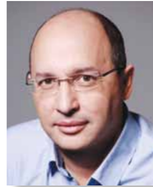
עובדות ועובדים יקרים,

הפרסום המופיע על גבי כתב העת הינו באחריות המפרסמים ועל דעתם בלבד! מערכת על הפיגומים אינה רואה עצמה אחראית בכל צורה לתכנים המופיעים בעמודי הפרסום והינם באחריותן של החברות המפרסמות בלבד! ט.ל.ח.