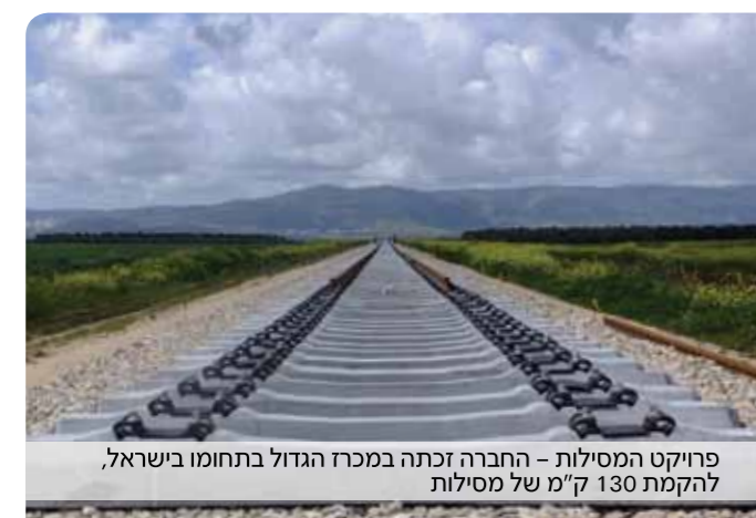
פרויקט המסילות - החברה זכתה במרכז הגדול בתחומי ישראל, להקמת 130 ק"מ של מסילות

הרכב המקצועי של החטיבה, הכולל מהנדסים מובילים בכל מגוון התחומים, מאפשר לנו להציע אחריות כוללת לניהול ההקמה, הרכש וההתקשרויות, ולספק ללקוח מתקן עובד, כולל אחריות לביצועי המתקן."