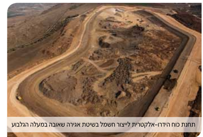
תחנת כוח הידרו-אלקטרית לייצור חשמל בשיטת אגירה שאובה במעלה הגלבע

שיכון ובינוי סולל בונה תשתיות מציעה ללקוחות מהמגזר העסקי את היתרונות של ניסיון מקצועי עשיר, לצד חדשנות בבנייה ברוח ערכי הקיימות. החברה המובילה בישראל בביצוע פרויקטים ומגה-פרויקטים, מנהלת פרויקטים מורכבים תוך שמירה על מצינות ואיכות בתכנון-ביצוע, עמידה חסרת פשרות בתקציב ובלוחות זמנים, לצד אחריות כוללת לטווח ארוך לכל היבטי הפרויקט. כמה חברות בישראל יכולות להעניק ביטחון כזה?