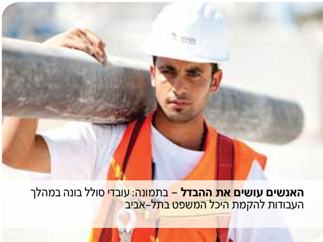
האנשים עושים את ההבדל - בתמונה: עובדי סולל בונה במהלך העבודות להקמת היכל המשפט בתל-אביב

מצוינות היא תוצר של אין-ספור פעולות שכל אחד מאתנו עושה מדי יום, כדרך חיים. איכות ויצירתיות פורצת דרך נשענות על מקצועיות ועבודת צוות, ועל מסירות ונחישות של מאות עובדים שרואים בהצלחת החברה את הצלחתם. אנו מטפחים את ערכינו אלה באמצעות השקעה במקצועיות העובדים וברוחותם