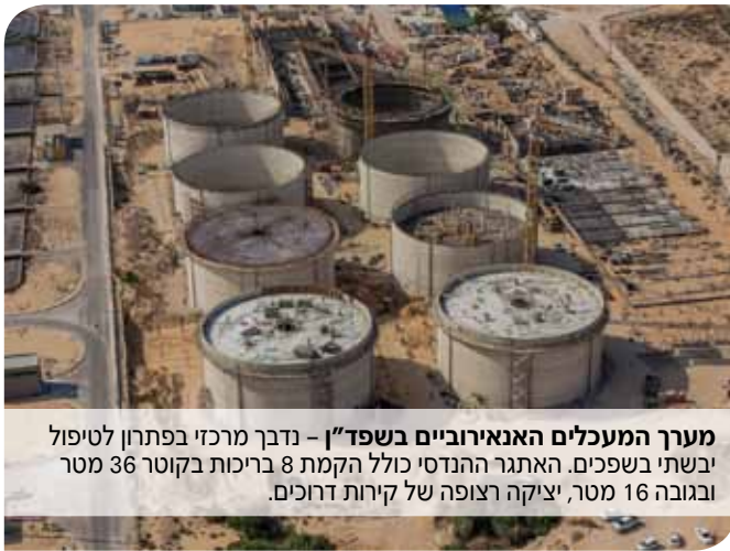
מערך המעכלים האנאירוביים בשפד"ן - נדבך מרכזי בפתרון לטיפול יבשתי בשפכים. האתגר ההנדסי כולל הקמת 8 בריכות בקוטר 36 מטר ובגובה 16 מטר, יציקה רצופה של קירות דרוכים.

שיכון ובינוי סולל בונה תשתיות מציעה ללקוחות המגזר העסקי את הסטנדרטים המקצועיים, הניסיון והאמינות של החברה המובילה בישראל בביצוע פרויקטים. היזמים שכבר בחרו בסולל בונה מעידים על האיכות הגבוהה, על עמידה חסרת פשרות בתקציב ובלוחות זמנים ועל אחריות ארוכת טווח לכל היבטי הפרויקט. כמה חברות בישראל יכולות להעניק בטחון כזה?