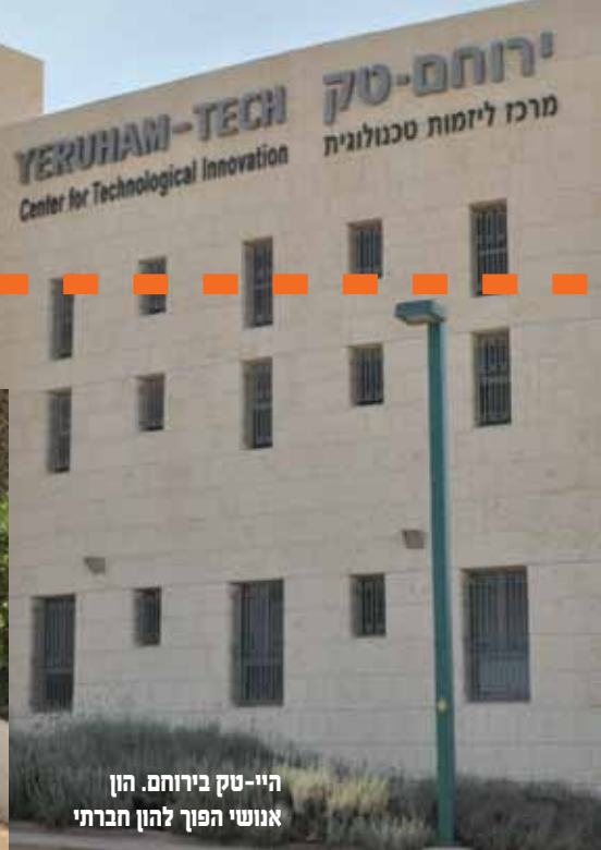
היי-טק בירוחם. הון אנושי הפוך להון חברתי