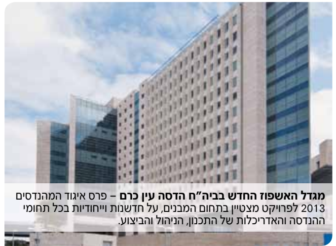
מגדל האשפוז החדש בביה"ח הדסה עין כרם - פרס איגוד המהנדסים 2013 לפרויקט מצטיין בתחום המבנים, על חדשנות וייחודיות בכל תחומי ההנדסה והאדריכלות של התכנון, הניהול והביצוע.