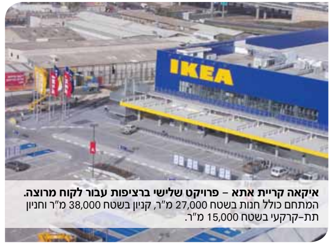
איקאה קריית אתא - פרויקט שלישי ברציפות עבור לקוח מרוצה. המתחם כולל חנות בשטח 27,000 מ"ר, קניון בשטח 38,000 מ"ר וחניון תת-קרקעי בשטח 15,000 מ"ר.