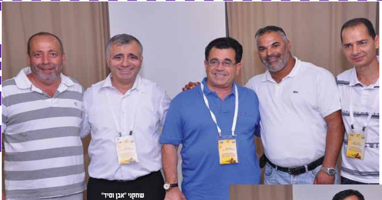
שחקני "אבן וסיד"